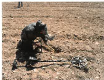
Intervención autorizada en el yacimiento arqueológico del Cabezo de Alcalá de Azaila, Teruel (Fotografía de F. Romeo extraída del artículo: "La tecnología de los detectores de metal principios de funcionamiento y análisis de los escenarios de expolio arqueológico").

En caso de que sea un objeto pequeño y corra grave peligro de desaparición o deterioro, recógelo con cuidado y mételo en una bolsa. No lo limpies , es más, si lo mantienes con parte de la tierra en la que se encuentra mejor. No olvides anotar la ubicación del lugar donde lo has hallado. Llama cuanto antes al BIBAT, Museo de Arqueología de Álava y concierta una cita para entregarlo.