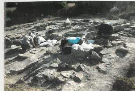
Intervención arqueológica en el templo de Nuestra Señora de Larrara, Alegría-Dulantzi.